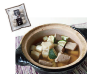
つみれと鯛のちり鍋