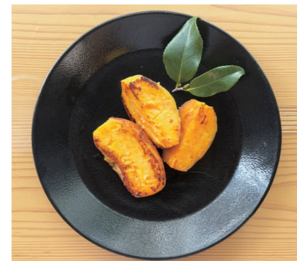
調理例 蒸かし芋のバター焼き