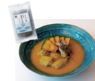
黒ずりみ団子とかぼちゃの和風ポタージュ