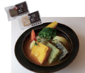
新春ばらもん揚げのトマトスープおでん