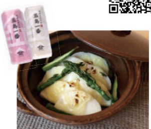
五島一番と野菜の柚子胡椒チーズ焼き